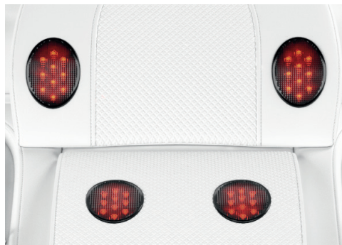
Abbildung 5: AnduMEDIC. Details Liege, Infrarot-Part