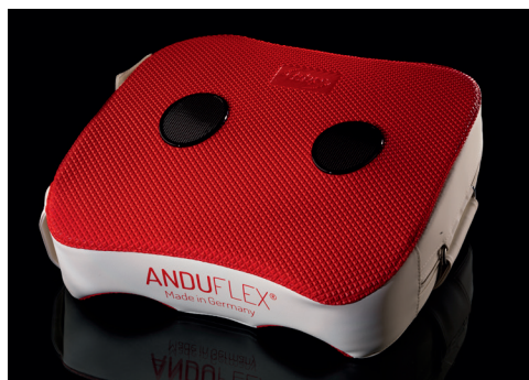
Abbildung 7: AnduFLEX Pad