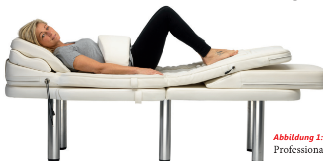
Abbildung 1: AnduMEDIC Professional in der Therapie

AnduMEDIC. Für Kliniken, Ärzte und Fachanwender zur effektiven Schmerzlinderung und zur schnellen Regeneration mit medizinischer Zertifizierung. Hilft bei verschiedenen Beschwerden: Rückenschmerzen, Fibromyalgie, Arthrose, Bandscheibenvorfall, Muskelschmerzen und Nackenschmerzen.