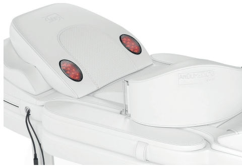
Abbildung 4: AnduMEDIC. Details Liege

Geistige und körperliche Belastungen schaffen ein gestörtes Gleichgewicht zwischen Spannung und Entspannung im Körper. Andullation® stellt dieses Gleichgewicht wieder her. Die Kombination aus Infrarot und Vibrationen fördert schnellere Erholung und besseren Schlaf.